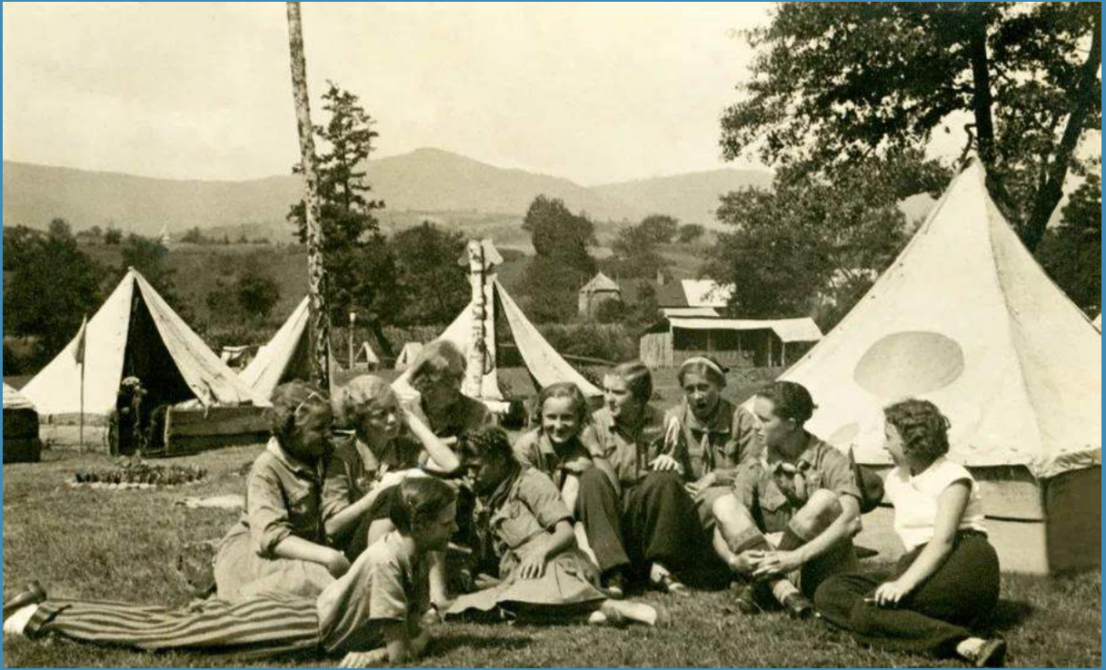
Пластовий табір у селі Солочин, 1934 р.