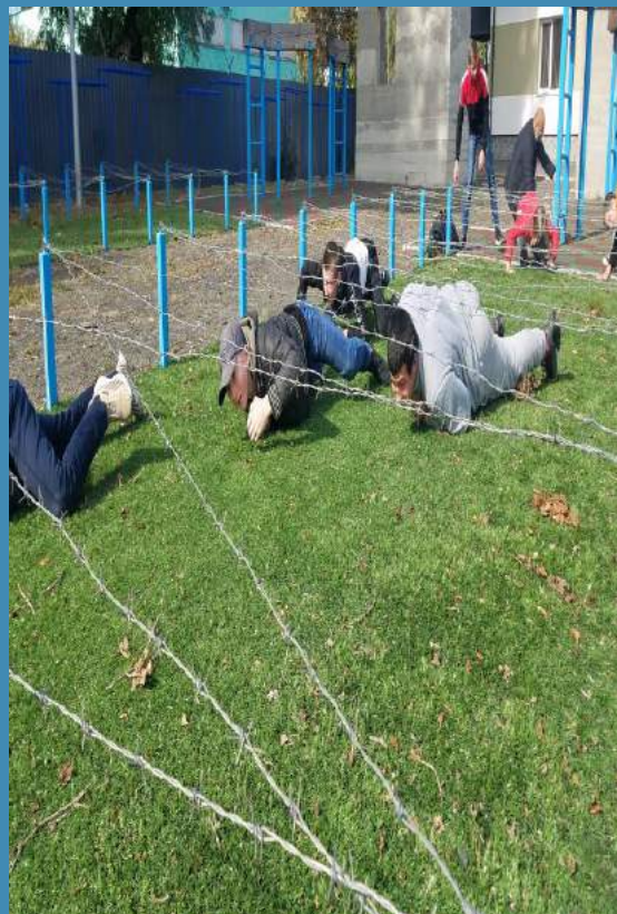
Поїздка в штаб 128 окремої гірсько-штурмової Закарпатської бригади