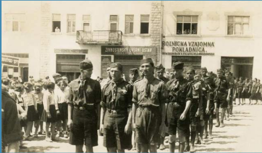
Похід пластунів на святі Матері, Хуст, 1936 р.

світ друковані сторінки “Пластуна”, – напише головний редактор Юліан Ревай.