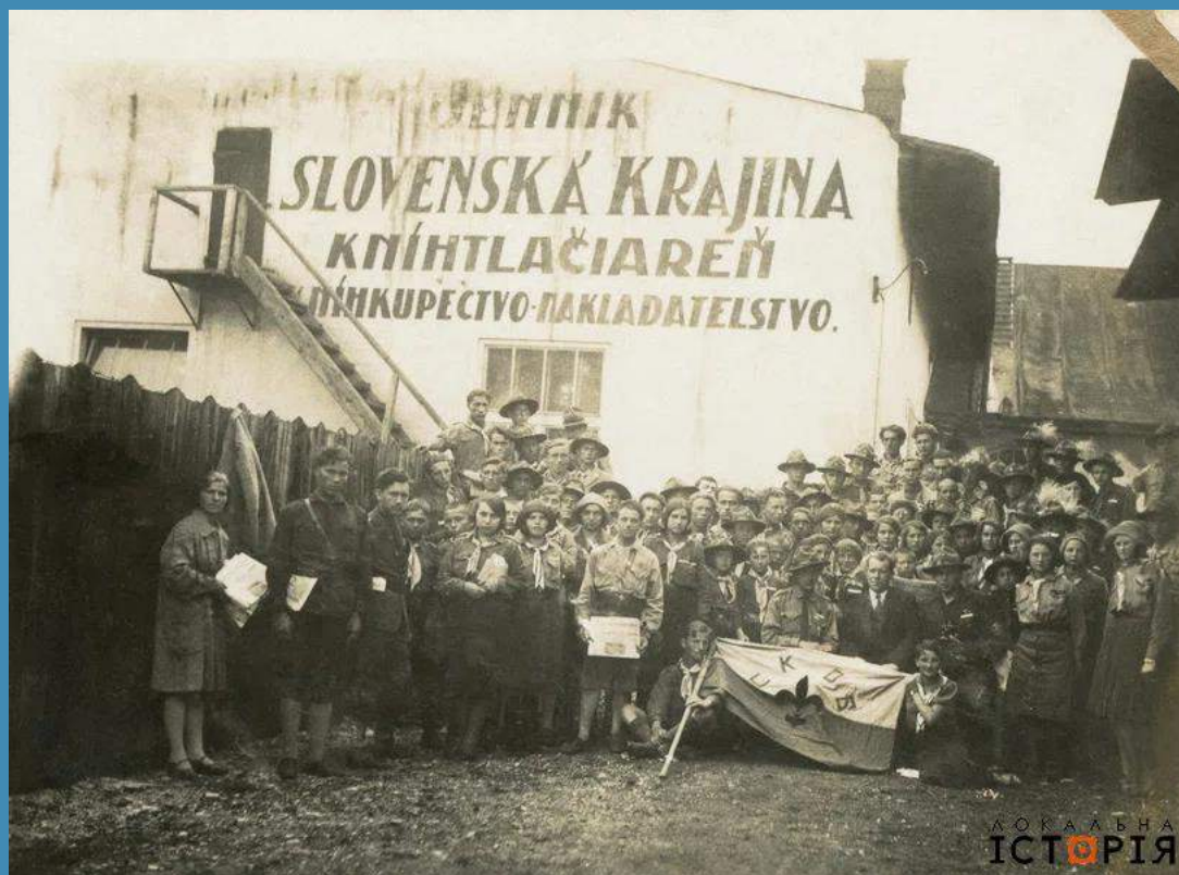
Український пласт на Закарпатті

У 1920-х “Пласт” на Закарпатті набув потужних обертів. Гуртки заснували в усіх найбільших містах – Ужгороді, Мукачеві, Перечині, Хусті, Тячеві, Рахові й Великому Березному. Кількість пластунів сягнула майже 1 000 осіб. А в 1929-му на Закарпатті навіть почала діяти структура Село-“Пласту”, яка залучила до українського скаутингу не лише гімназійну, а й сільську молодь.