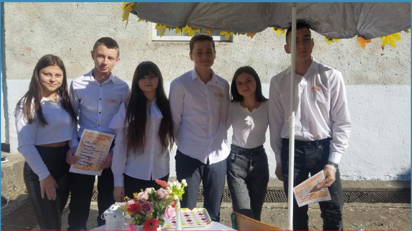
Осінній ярмарок Композиція "Осіння кав'ярня"