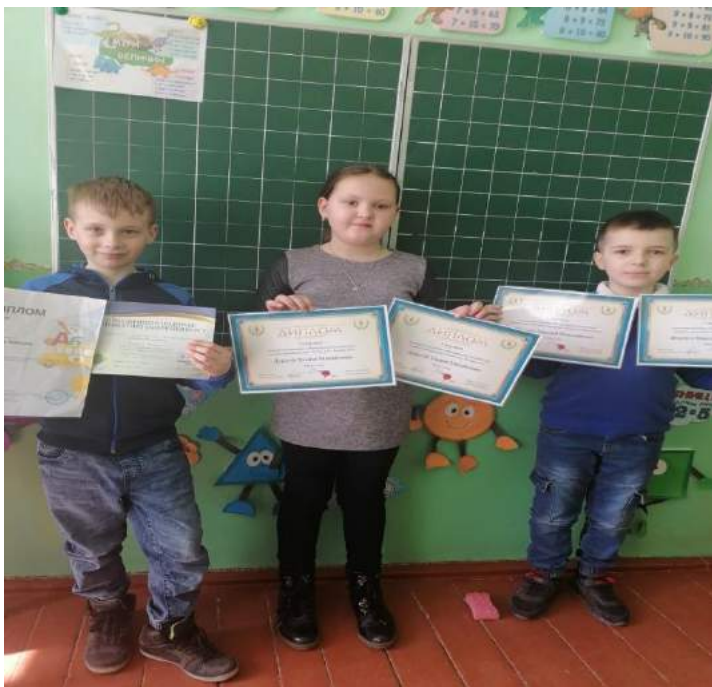
Участь у Всеукраїнському конкурсі «Олімпіс»