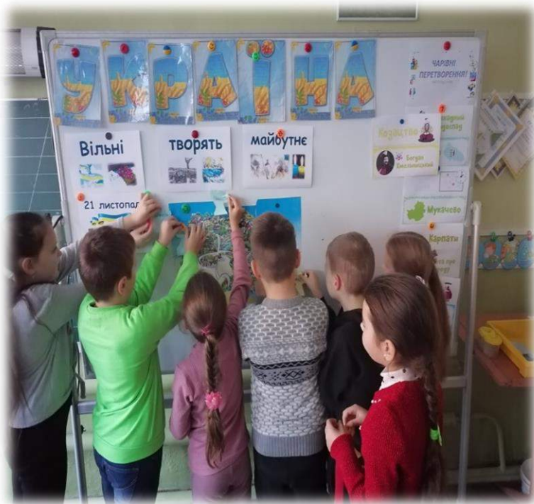
Створення міні проєкту до Дня Гідності та Свободи