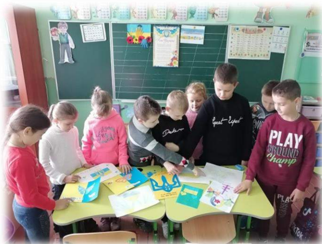
Конкурс малюнків до Дня захисника України