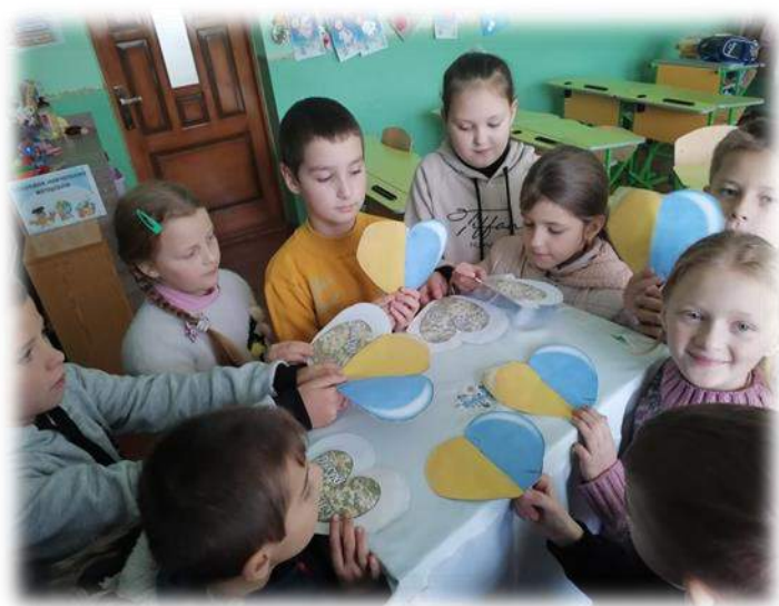
Виготовлення виробу «Оберіг для захисників»