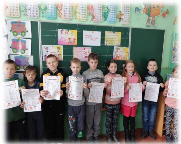
Виховна година «Здоров'я – найцінніший скарб людини»