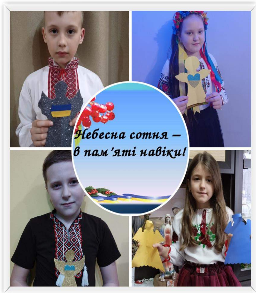
Тиха акція «Ангели пам'яті»