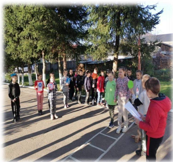
Гра – вікторина «Знавець правил дорожнього руху»