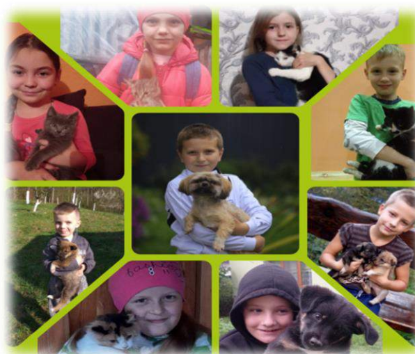
Челендж «Я та мій домашній улюбленець»