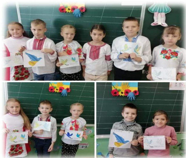
У рамках Міжнародного дня миру, з метою виховання в учнів національної самосвідомості, відбувся конкурс малюнків «Голуб миру»