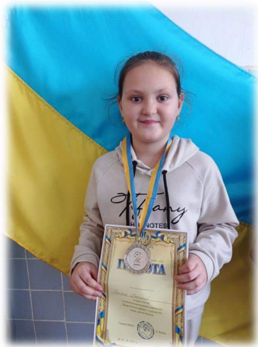
Участь у Всеукраїнському конкурсі «Мовознавець»