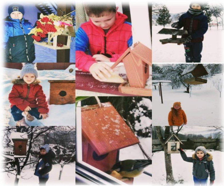
Участь в акції «Нагодуй птахів взимку!»