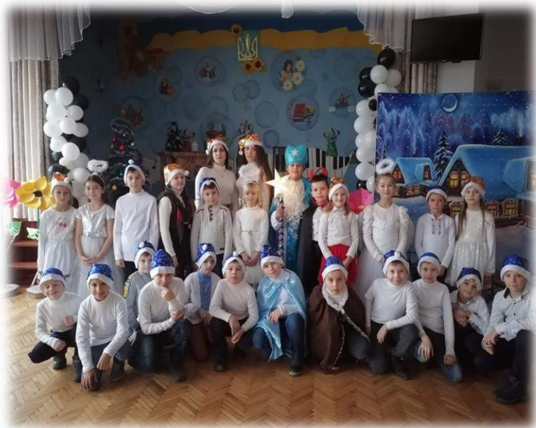
Виховний захід «Миколай, Миколай, подарунки роздай!»