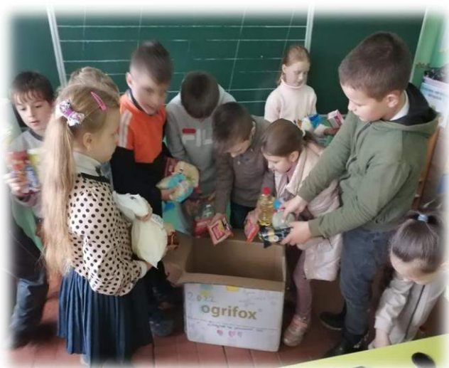
Акція по збору продуктових наборів для ЗСУ «Військовим допомагаємо, перемогу наближаємо!»