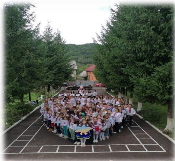
Участь у флешмобі до Міжнародного дня миру