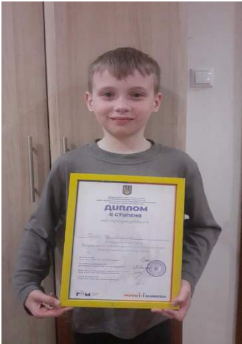
Участь у Всеукраїнському конкурсі «Мовознавець»