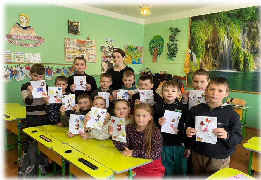
Виготовлення аплікації «Листівка для мами»