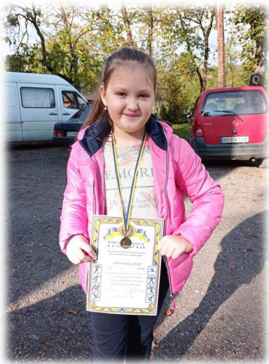
Участь в змагання з шашок